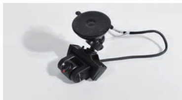
車内用リアカメラ (0.3m)