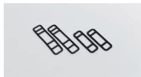
■取り付け用ゴムバンド (2種類)