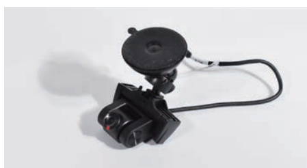
■車内用リアカメラ (0.3m)