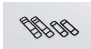
取り付け用ゴムバンド(2種類)