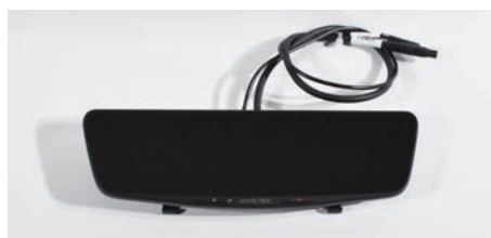
デジタルミラー本体