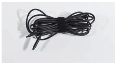
リアカメラ延長ケーブル