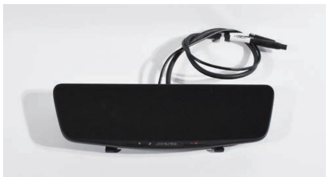
■デジタルミラー (バンド装着タイプ) 本体