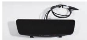
デジタルミラー本体